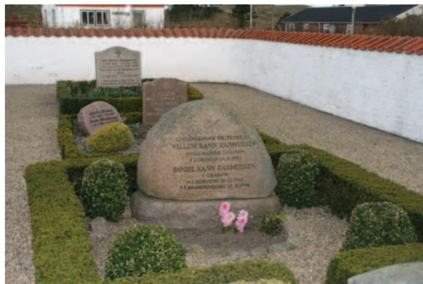
Villum Kann Rasmussen fødtes på Mandø i 1909 og ligger begravet på øen. Han opfandt et ovenlysvindue og skabte en af Danmarks største erhvervsvirksomheder, Velux A/S og VKR Holding.

Opfindelser er en modpol til strukturudvikling, idet en opfindelse ofte kan skabe sit eget marked. Henry Ford er citeret for at have udtalt, at hvis han på et tidligt tidspunkt havde spurgt sine kommende kunder, hvad de ønskede sig, ville de have svaret: "En hurtigere hest"! I stedet industrialiserede Henry Ford som bekendt fremstillingen af en af den tids store opfindelser, automobilet, og se, hvad det førte til! Det ligger i sagens natur, at der på småøerne er sket en betydelig selektion af selvhjulpne og i mange tilfælde autodidakte personligheder, som ikke er voldsomt belastet af viden om alt det, som ikke er gennemførligt. Givet er det derfor, at der findes snurrige hjerner på småøerne, som kan opfinde og faktisk gør opfindelser. Eksempelvis kan man på Mandø se gravstedet for en af øens sønner, Villum Kann Rasmussen, som ud over at gøre opfindelser også forstod at udnytte opfindelserne erhvervsomt og byggede en meget stor virksomhed (Velux A/S og VKR Holding) baseret på ovenlysvinduet. For lokalsamfundet får opfindelser imidlertid først betydning, hvis de omsættes til beskæftigelse i lokalsamfundet, hvilket lige netop ikke var tilfældet for Mandø og ovenlysvinduet.