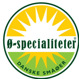
Småøernes Fødevarer-netværk har naturligvis et logo til varemærket

Ø-specialiteter® er et registreret varemærke ejet af Småøernes Fødevarer-netværk (se Christensen, 2010a). Det blev skabt efter lange og svære diskussioner imellem de interesser, der fortsat ønskede "det gode liv" omkring en mikroproduktionsvirksomhed kombineret med kulinarisk oplevelsesturisme på den ene side; og på den anden side det synspunkt at vundne bastioner og goodwill i den øvrige befolkning skulle udnyttes til at skabe produktion med volumen og virksomheder med varige arbejdspladser og ret til ferie, sygedagpenge og en 37 timers arbejdsuge som på det øvrige arbejdsmarked. Skabt blev varemærket – godt hjulpet af behovet for volumen, som på daværende tidspunkt opstod i flere ø-virksomheder. Og skabt blev det med det formål at udvikle en fælles profilering af specialfødevarerproducenter på småøerne for dermed at udgøre et banner, hvorunder fælles markedsføring og distribution kan udfolde sig. Varemærket har desuden fået den funktion indadtil på småøerne at forsøge at synliggøre de muligheder, som man på småøerne gerne skal blive flere producenter om at udnytte.